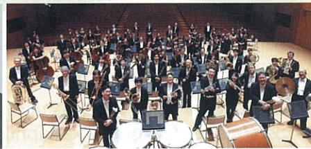
神奈川フィルハーモニー管弦楽団