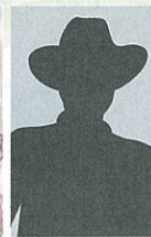
スペシャルゲスト! 神のヴァイオリニスト