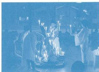
キャンドルファイヤー