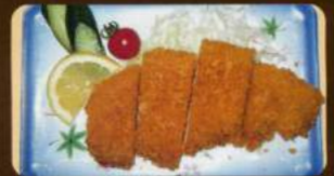
もち豚トンカツ (510円)