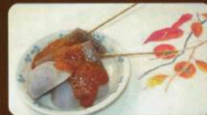
こんにゃく田楽 (310円)