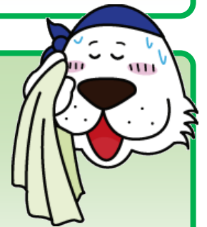
キャプテンわん (C)ゆず華・(公財)横浜市体育協会