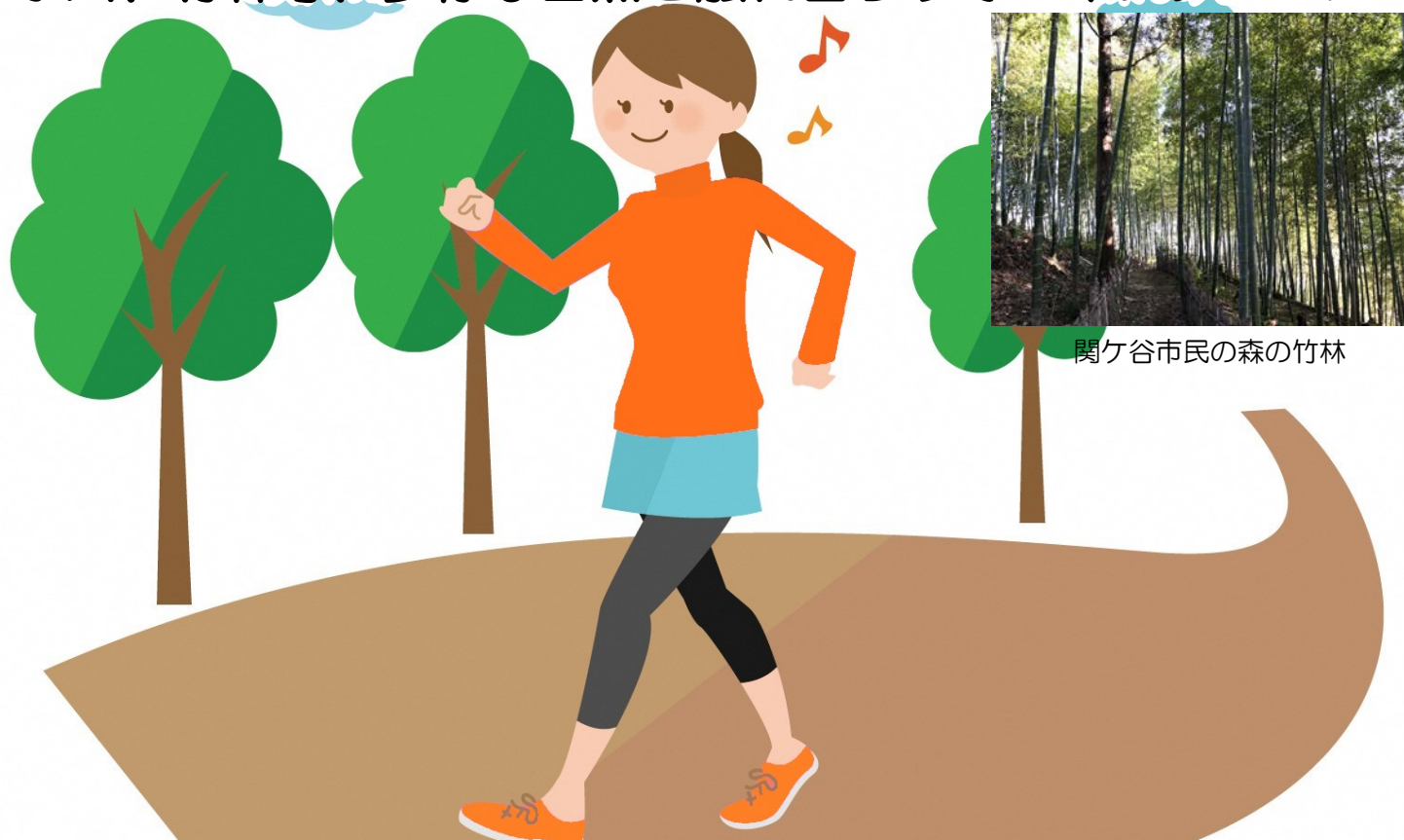
関ヶ谷市民の森の竹林

多くの自然に囲まれた金沢区 小川、竹林等、多様な自然と触れ合うウォーキングコース