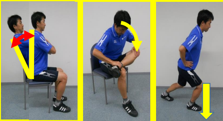
股関節伸展制限の改善運動基本例

今回はその「姿勢改善運動」をテーマに 姿勢改善の指導方法、動きの実践と応用できる運動を紹介する ワークショップ講座を開催します。